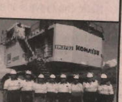
Mining & Construction