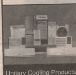
Unitary Cooling Products

नोंदणीकृत कार्यालय : व्होल्टास हाऊस, ए. डॉ. बाबासाहेब आंबेडकर रोड, चिंचपोकळी, मुंबई ४०० ०३३, भारत. दूर. क्र.: ९१ २२ ६६६५६६६६, फॅक्स क्र.: ९१ २२ ६६६५६२३१ ई-मेल : shareservices@voltas.com , वेबसाइट : www.voltas.com सीआयएन : L29308MH1954PLC009371