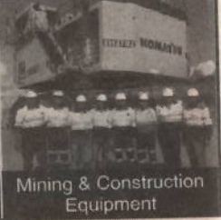
Mining & Construction Equipment