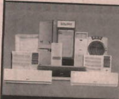
Unitary Cooling Products

Registered Office : Voltas House 'A', Dr. Babasaheb Ambedkar Road, Chinchpokli, Mumbai 400 033, India. Tel. No. : 91 22 66656666 Fax No. : 91 22 66656231 e-mail : shareservices@voltas.com Website : www.voltas.com CIN : L29308MH1954PLC009371